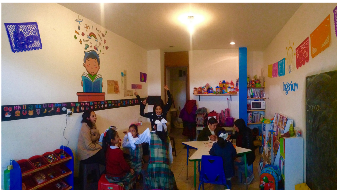
Imagen 1. Club de Tareas Ingenium

por lo significativas que resultan en la noción de agencia, se incorporan de manera paralela a la descripción del lugar y dinámicas en su interior, con la intención de exponer los resultados del trabajo de campo en dos planos: el que resultó de la observación y el que derivó de los diálogos con los niños.