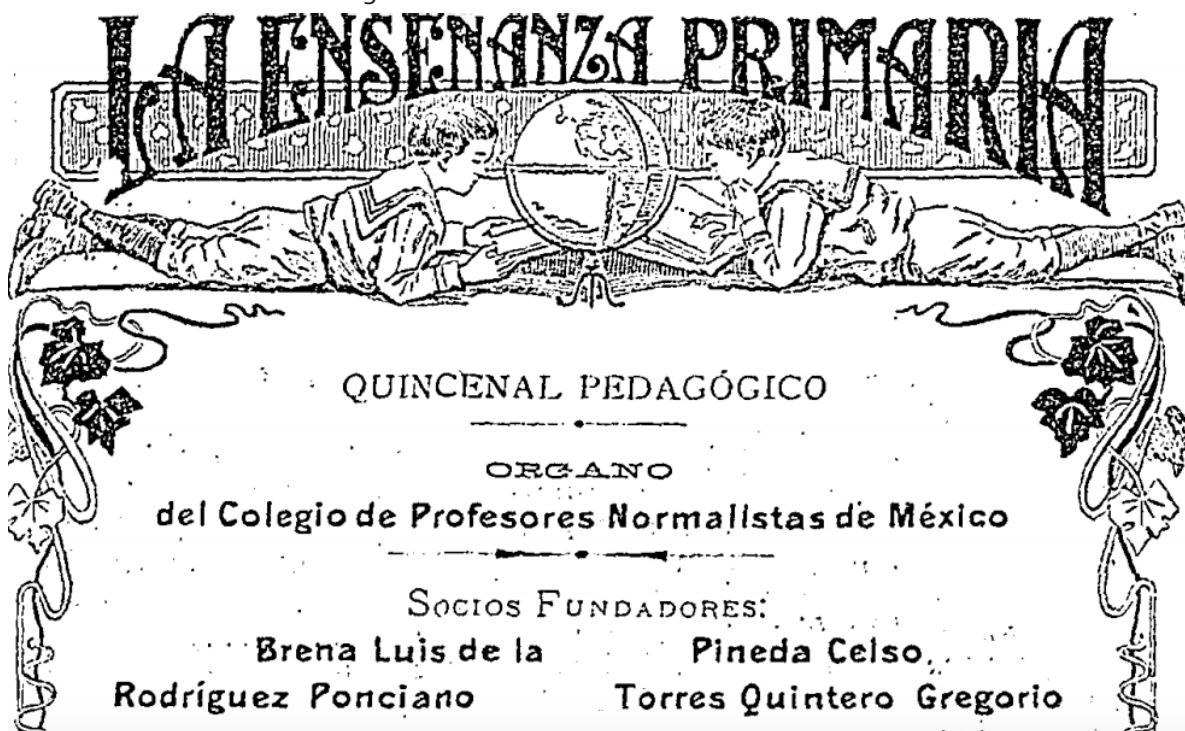
Imagen 1. Portada de La Enseñanza Primaria